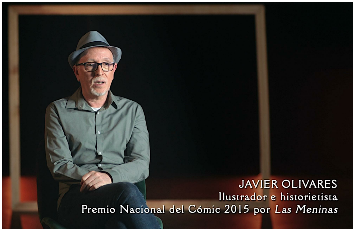
JAVIER OLIVARES Ilustrador e historietista Premio Nacional del Cómic 2015 por Las Meninas